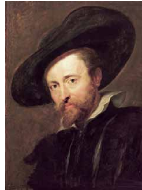
Peter Paul Rubens, zelfportret, ca. 1630. Olieverf op paneel.

Op donderdag 9 maart, van 10 tot 17u, stelt het Koninklijk Instituut voor het Kunstpatrimonium (KIK) te Brussel zijn deuren open. Het is een unieke gelegenheid om met eigen ogen te aanschouwen hoe men er te werk gaat bij de studie en restauratie van kunstwerken. Twee topwerken die momenteel in het KIK verblijven, zijn 'De Dulle Griet' van Pieter Bruegel de Oude uit het Museum Mayer van den Bergh, en het zelfportret van Rubens uit het Rubenshuis. Beide werken worden er momenteel onderzocht om vervolgens gerestaureerd te worden. In 2018 zouden ze terug naar Antwerpen moeten keren, om te schitteren op het barokjaar 2018 en het Bruegeljaar 2019. www.kikirpa.be