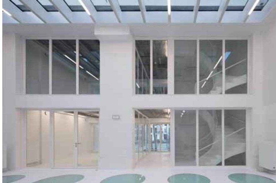
Gezicht op het nieuwe gebouw van MAD Brussels, met de overgang tussen de kantoren en het meer publieke en private gedeelte van het gebouw.

Sinds kort kunnen meer dan 392.000 Brugse erfgoedstukken online bekeken worden. Via www.erfgoedbrugge.be zijn de collecties van onder meer de Musea Brugge, de Openbare Bibliotheek Brugge, het Stadsarchief Brugge en de Dienst Monumentenzorg en Erfgoedzaken te doorzoeken. Uiteindelijk wordt het virtuele verzamelplek voor 16 unieke Brugse erfgoedcollecties +++ Op 20 april huldigt het Brussels expertise- en promotieplatform voor mode en design MAD Brussels officieel zijn nieuwe gebouw in. Dit gebouw is gelegen tussen de Nieuwe Graanmarkt en de Papenest, is een ontwerp van architectencollectief V+